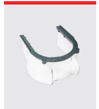
マグネット式 樹脂安全ガード