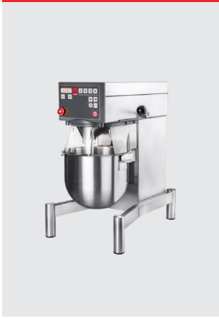
10 L テーブルモデル (ステンレスフレーム)