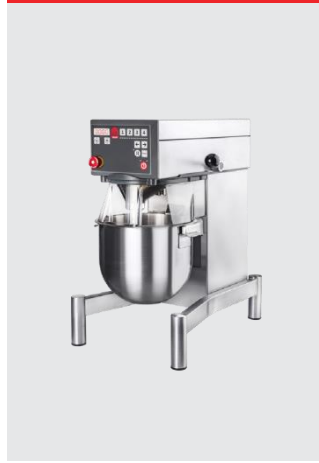
船上使用モデル (ステンレスフレーム)