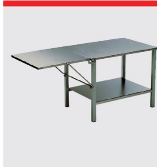
RN10用 ステンレス作業テーブル