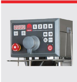
アタッチメントドライブ