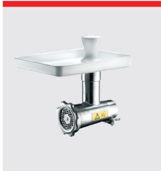
ミートミンサー (70 mm)