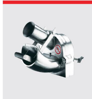
ベジタブルカッター-GR10