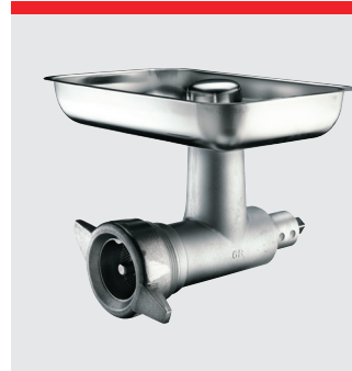
Köttkvarn, 82 mm