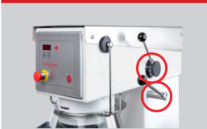
VL-1 – Manuell hastighetsreglering och manuell sänkning av kitteln