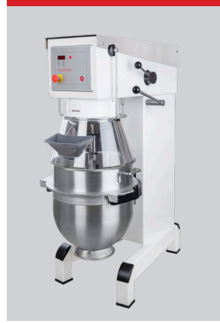
Pizzaversion, vit, pulverbelagd