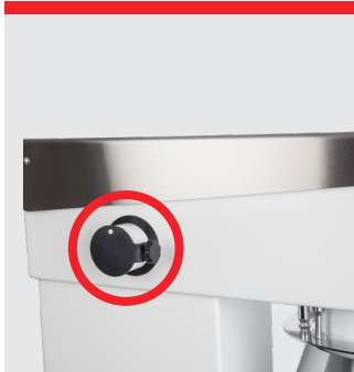
Hjälputtag för köttkvarn och grönsaksskärare