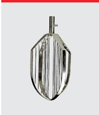
Vingvisp, rostfritt stål