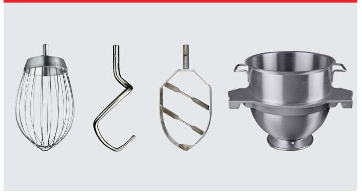
Visp, krok, blandningsspade och kittel 60/30 liter i rostfritt stål.