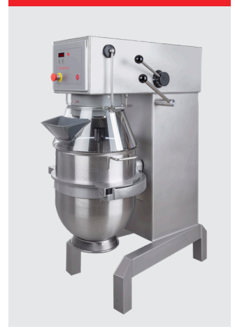
Marinversion, rostfritt stål