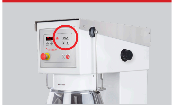
VL-1S – Automatisk hastighetsreglering och automatisk sänkning av kitteln