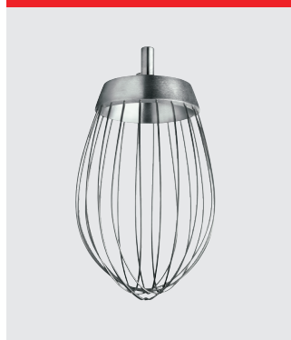
Visp med tunnare trådar, rostfritt stål