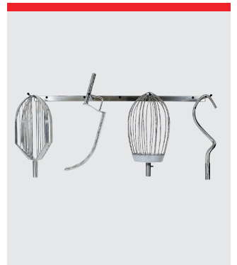
Redskapshängare, 127 cm