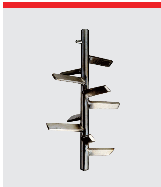
Pulverblandare, rostfritt stål