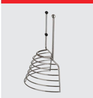
Gallerskydd i rostfritt stål. Ej CE-certifierat